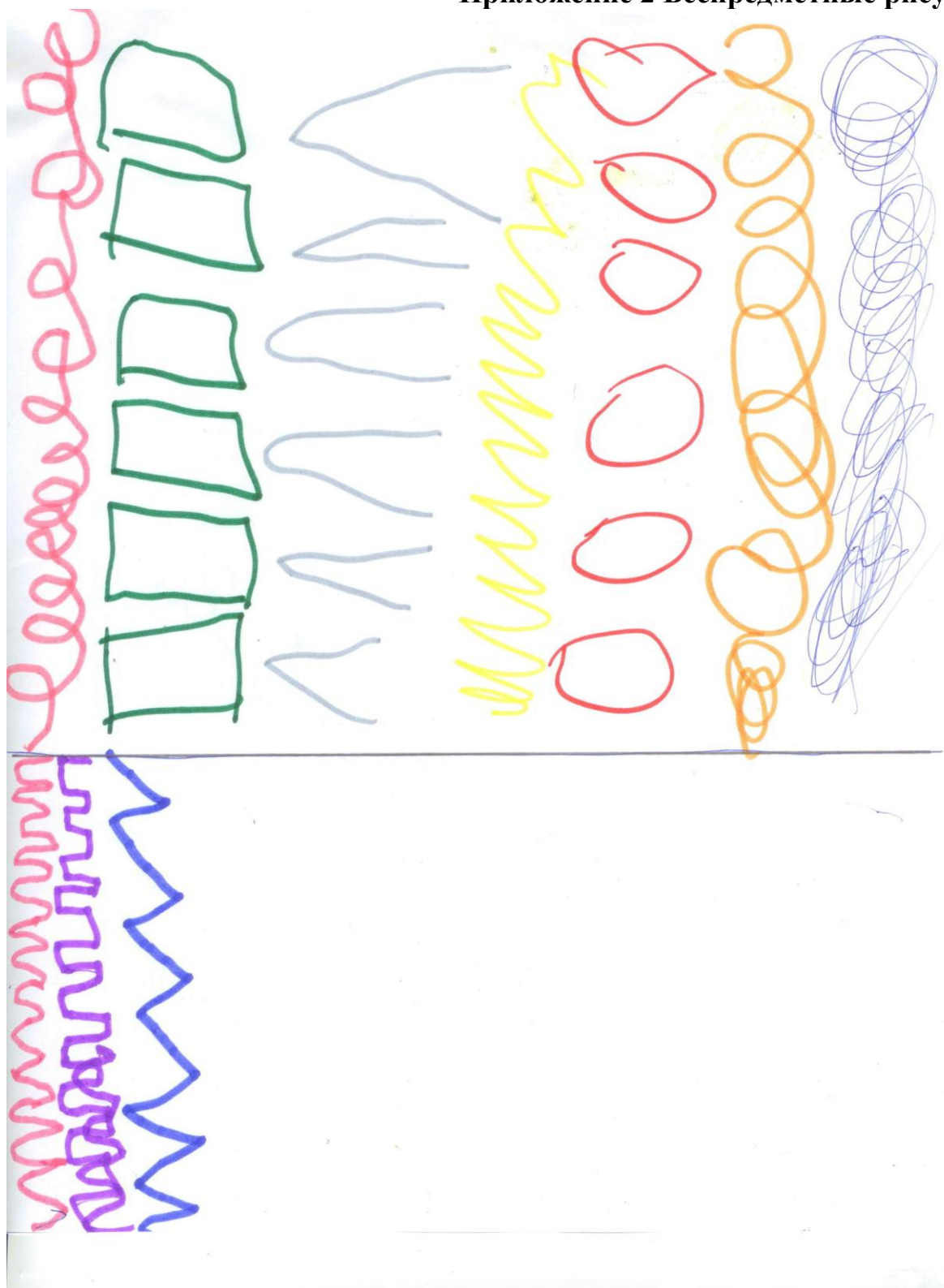
Шульга Данил, 5 лет Нижний рисунок: Ж. Ф. Рамо «Радость». Верхний рисунок: М. Мусоргский «Слеза».